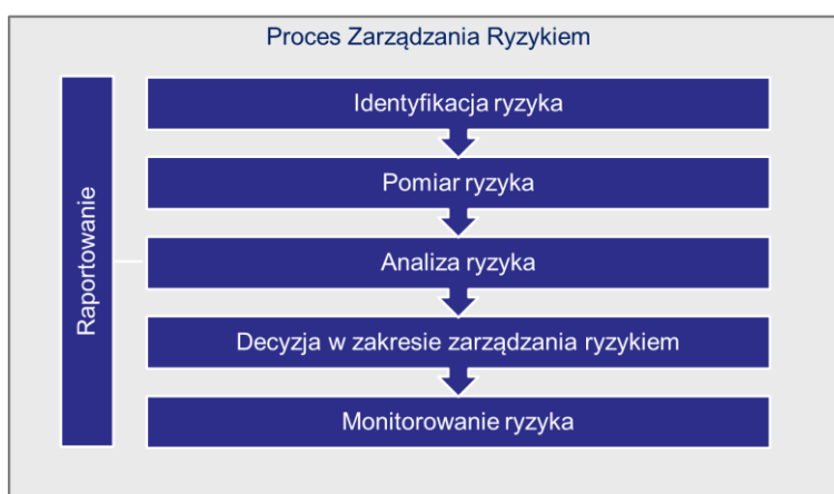
Rysunek 3. Schemat procesu zarządzania ryzykiem

Nie jest to proces całkowicie sekwencyjny, lecz cykl kontrolny, w którym występują ścieżki reagowania jak i zapobiegania. Ponadto stosuje się równoległe procesy zapewnienia jakości oraz kontroli na wszystkich etapach procesu zarządzania ryzykiem. Podstawowe procesy zarządzania ryzykiem, takie jak wyliczanie kapitałowego wymogu wypłacalności, roczna sprawozdawczość dotycząca ryzyka, czy własna ocena ryzyk i wypłacalności zostały opisane w następnych rozdziałach.